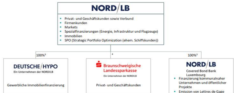
Abbildung 1: Konzernstruktur der NORD/LB

Die wesentliche Konzernstruktur der NORD/LB stellt sich folgendermaßen dar: